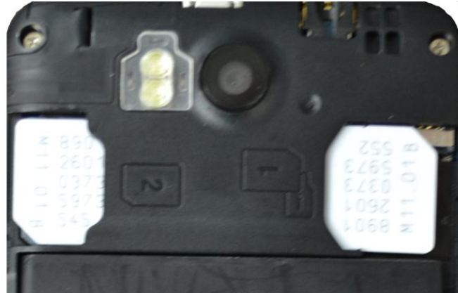
Full SIM Card Install